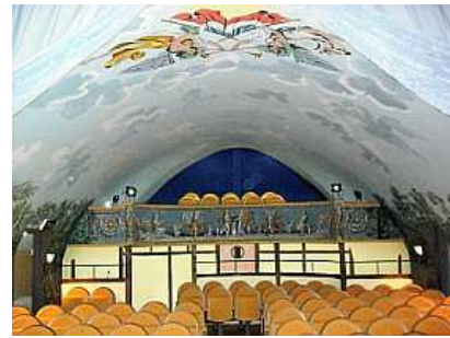
Vue salle et mezzanine